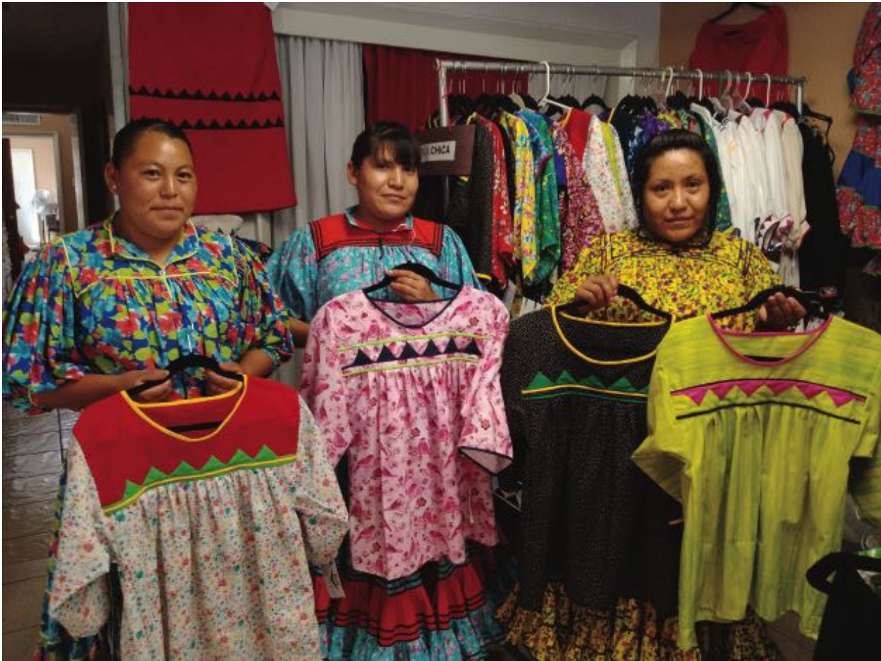
Foto 5: Proyecto Emprende por un Cambio Social de Celiderh y FECHAC