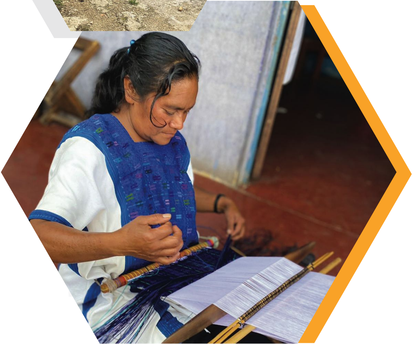
Foto 2: Amigos de San Cirstóbal