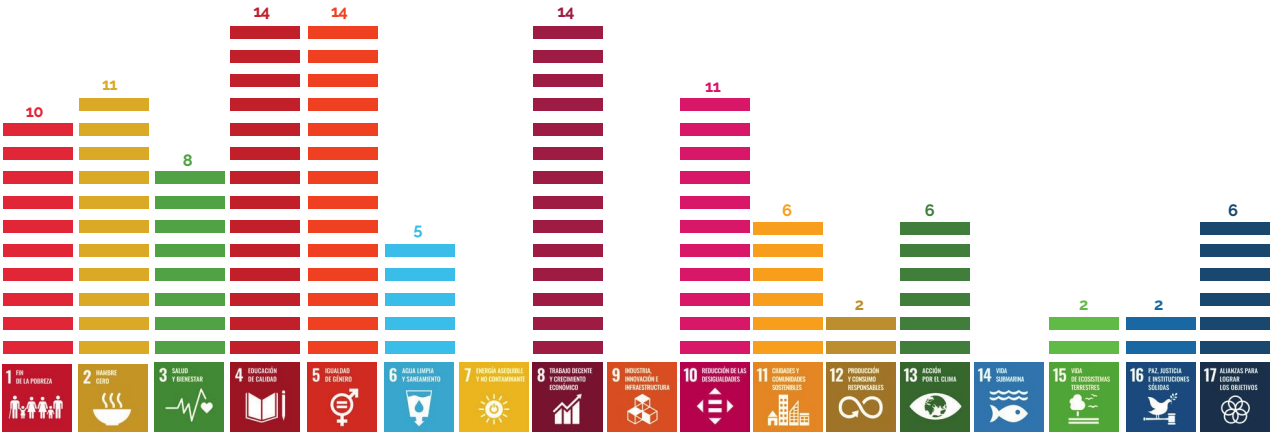
(Fondo Comunidades Activas - fase 2 Resumen de proyectos).