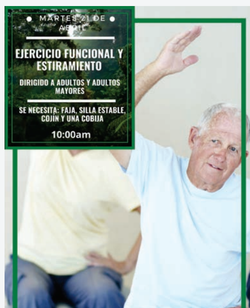
Taller de ejercicios funcionales, parte del trabajo de la subcomisión de Salud, Educación y Recreación