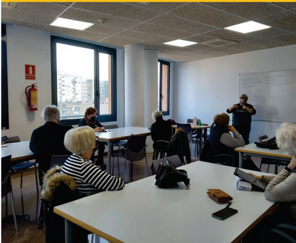
Formación grupal para gente mayor en Badia del Vallès