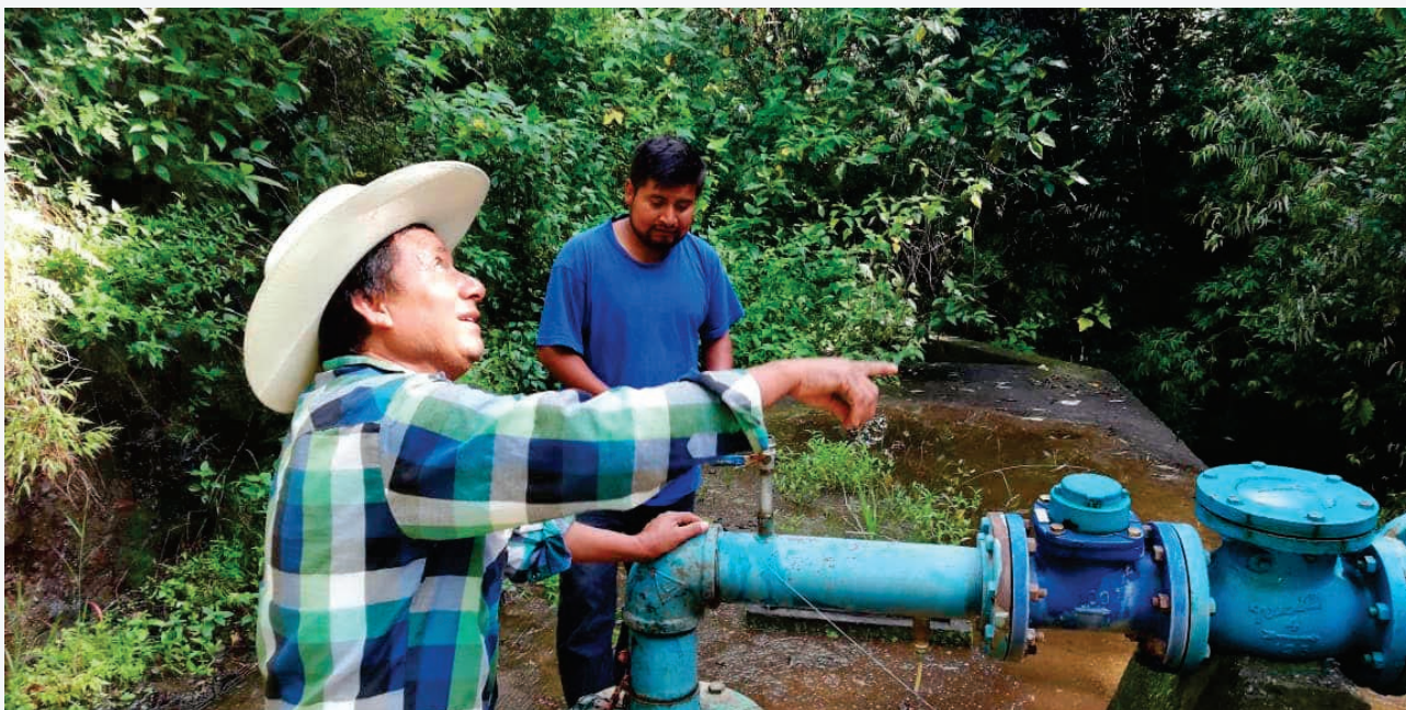
Fundación Comunitaria Puebla: proyecto para mejorar el acceso al agua en la comunidad de San Francisco Xochiteopan