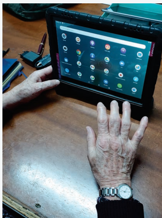
Formación con una de las tablets en préstamo a una persona mayor

Otra estrategia que contó con el apoyo y protagonismo de la comunidad fue lo que llamaron “antenas”. La Fundación cuenta con la ayuda de personas que trabajan en farmacias, comercios, puntos de servicios que tienen contacto con el público de personas mayores para que ellos detectan entre sus clientes aquellas personas que pueden tener soledad no deseada. Ellos entregan folletos con las informaciones acerca del proyecto y tarjetas con los contactos de la fundación. Con eso llegan a casos más difíciles de acceder, con la colaboración y involucramiento directo de la comunidad.