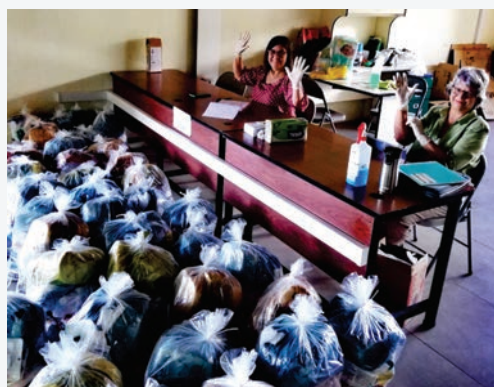
Trabajo de la subcomisión de Ayuda Social