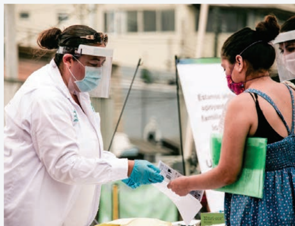
Entrega de vouchers solidarios de AbrazaNL, un ejemplo de trabajo en alianza entre la Fundación Unir y Dar A.C. y otras organizaciones de Monterrey

“(...) al encontrarse posicionada en el ecosistema de inversión social local pudo capitalizar la oportunidad del Fondo (Fondo Comunidades Activas) para articularla con un esfuerzo a gran escala que se estaba generando en la localidad, el Fondo Unir y Dar. El cual impulsó cuatro esfuerzos para atender las consecuencias de la pandemia en diversas poblaciones objetivo: RespiraNL, ReactivaNL, EducaNL y AbrazaNL. Es así que en lugar de generar otro proyecto adicional a los esfuerzos impulsados por diversos actores que posiblemente podría llegar a tener un menor alcance, sumó y coinvertió los recursos disponibles para generar un mayor impacto a través de un mecanismo establecido que se encontraba generando resultados” (COMUNALIA, 2021).