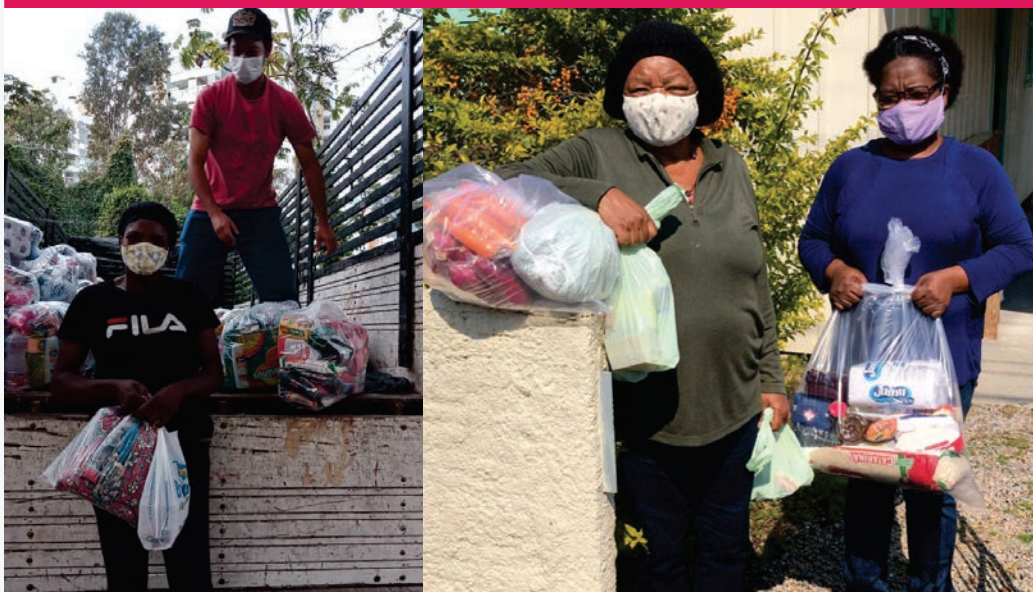
Entregas de alimentos hechas por iniciativas apoyadas por la "Linha de Apoio Emergencial Coronavírus", de ICOM

+1.000 familias recibieron monedas sociales