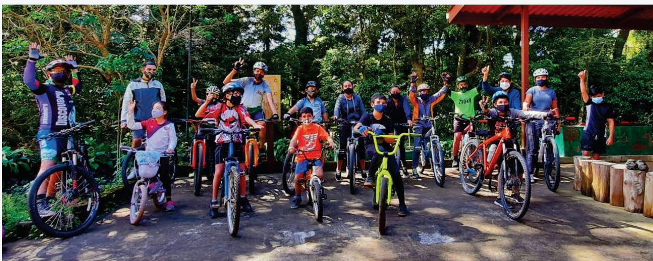
Taller de principios ciclísticos, parte del trabajo de la subcomisión de Salud, Educación y Recreación

“Si estamos viendo cuál es el impacto económico de todas las intervenciones, no podemos mirar solamente cual es el impacto en cantidad en dólares, también el impacto de crear una economía más resiliente que responde especialmente durante tiempo de crisis. Eso es incalculable. El hecho de crear una economía que buscaba ser autosostenible creó un impacto duradero. Es muy difícil de medir pero creo que no lo podemos ignorar”.