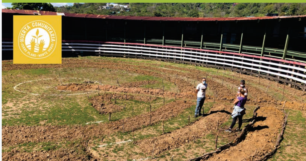
Huerta Comunitaria en la comunidad de Cerro Plano, un proyecto de la subcomisión de Economía Circular y que recibió microdonaciones del Fondo Comunitario Monteverde

+US$ 11 mil invertidos en microdonaciones a proyectos comunitarios